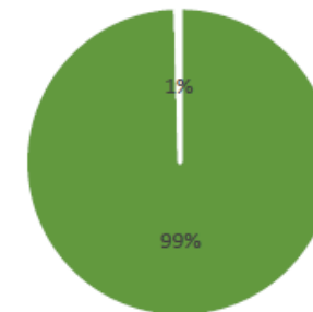
Uitstoot scope 1 en 2